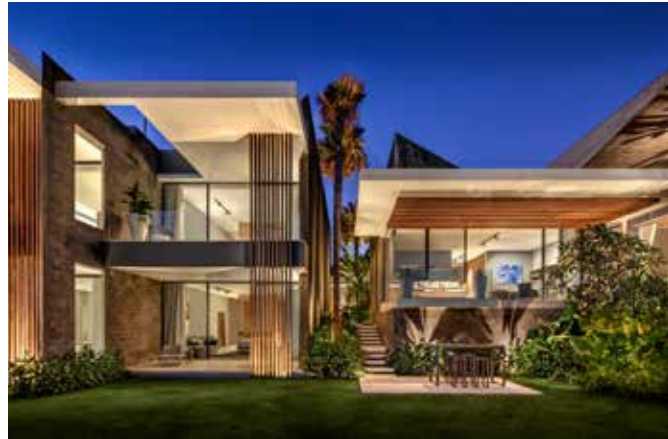
När mörkret faller får huset en ny karaktär.

PÅ HALVÖN BUKITS SYDVÄSTRA spets ligger Balis legendariska strandparadis Uluwatu, som är känt för att ha några av världens bästa stränder för surfing. Hit vallfärdar surfare från hela världen, i jakten på perfekta vågor och gnistrande sanddynor. På balinesiska betyder Ulu topp och watu klippa, och namnet passar verkligen halvöns råa skönhet. Och långt ovanför det turkoskimrande vattnet, med ett dramatiskt läge högst uppe på en kalkstensklippa, ligger ett hus som speglar just den skönheten.