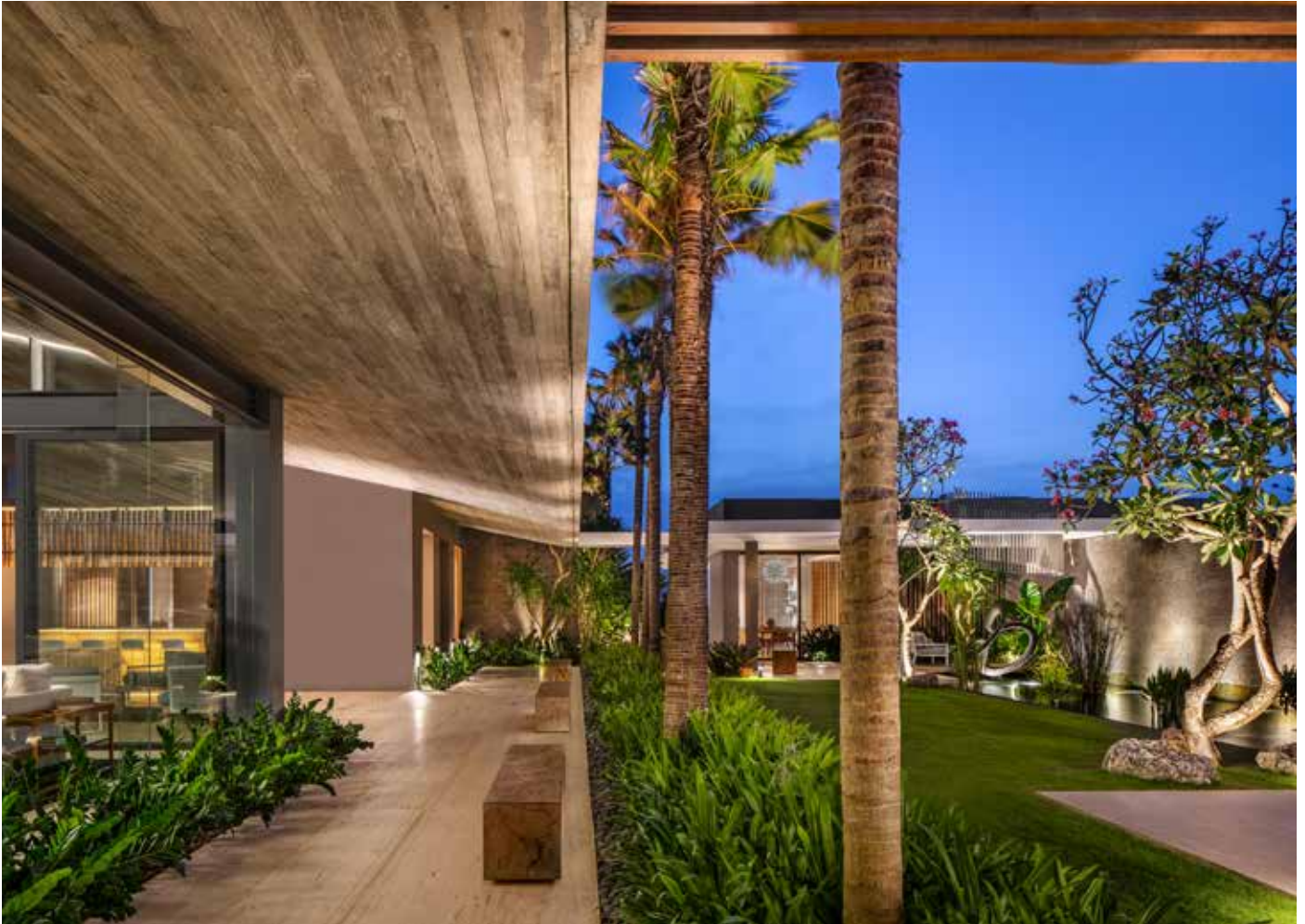
Naturen tillåts ta stor plats på innergården.