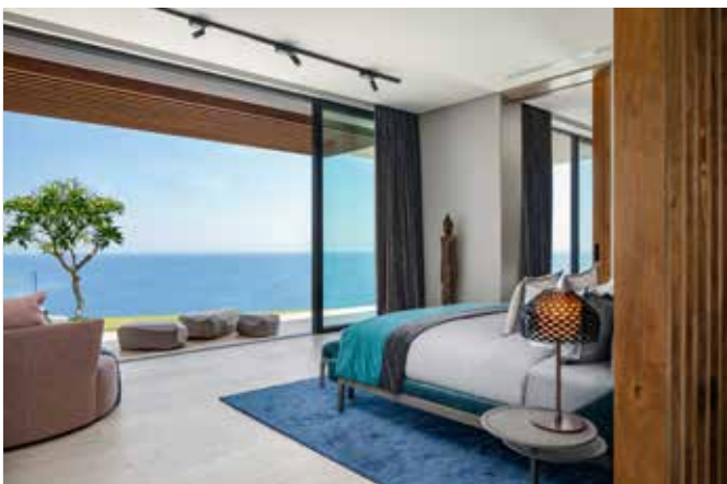
Även i sovrummet spelar utsikten huvudrollen.

PRECIS SOM EN RESORT har huset en något fragmenterad karaktär och består av flera olika byggnader, som binds samman av små vägar i trädgården. Likt en kameleont kan hemmet ändra skepnad och krympa eller expandera, beroende på om ägarfamiljen vistas där själva eller om de har gäster. En rad trädgårdar och planterade terrasser är skicklig invävd i arkitekturen och kombinerar både strukturerad och otuktad växtlighet, vilket skapar en känsla av samhörighet mellan landskapsarkitektur och närmiljö.