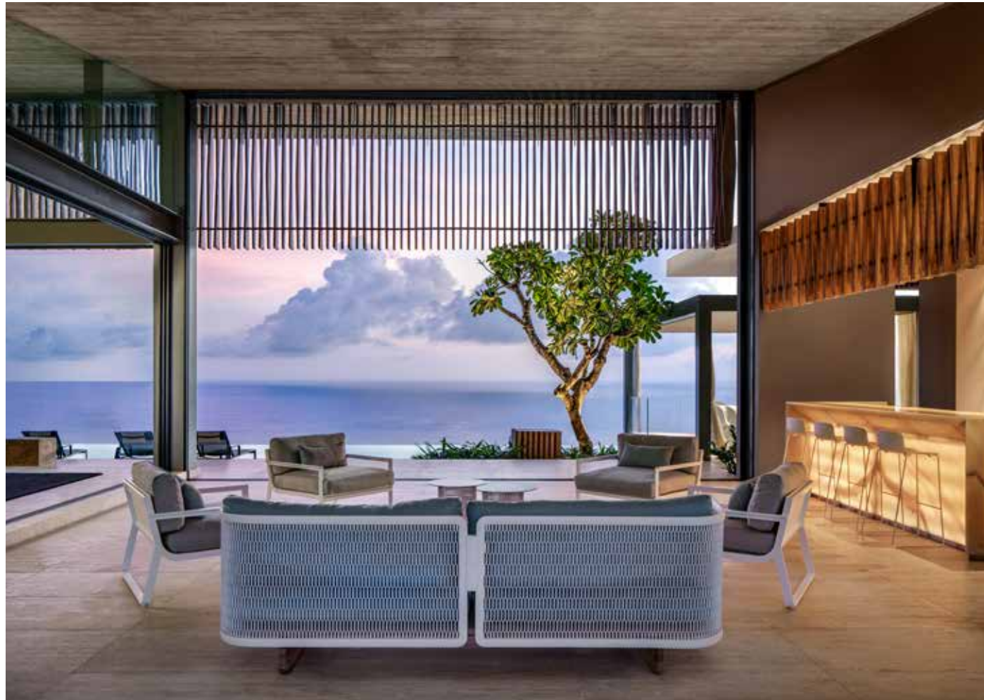
Enorma fönster ramar in utsikten över Indiska oceanen.

DE SYDAFRIKANSKA arkitekterna på SAOTA:s ambition var att skapa ett hem med tydlig inspiration från Balis många exklusiva semesteranläggningar. Uppdragsgivarna hade i många år besökt ön som turister och förläskat sig i dess vackra hotell. Och husets entré skulle utan tvekan passa vilket lyxhotell som helst – en lång trappa kantas av en terrasserad damm som med ett hemtrevligt porlande sätter tonen för detta i alla avseenden extraordinära hem.