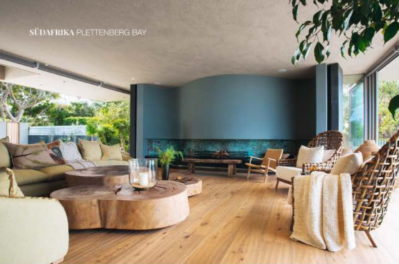
MEHR MEER Wie eine Erweiterung des Ozeans wirkt die Feuerstelle, sowohl in Form als auch in Farbe, entstanden durch oxidiertes Kupfer.