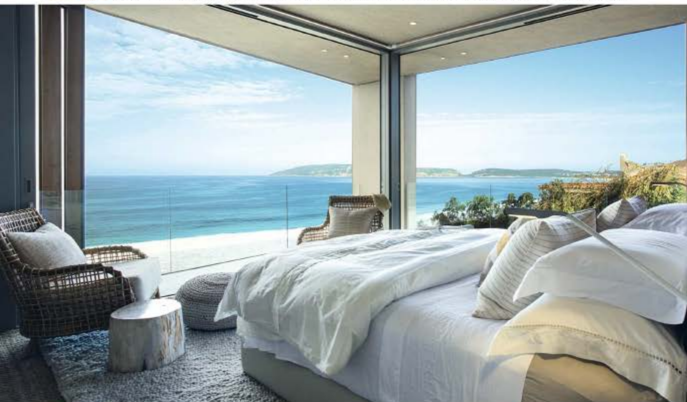
TRAUMHAFT Das Schlafzimmer ist im höheren Teil gelegen, um beim Aufwachen die Aussicht auf den Indischen Ozean genießen zu können.