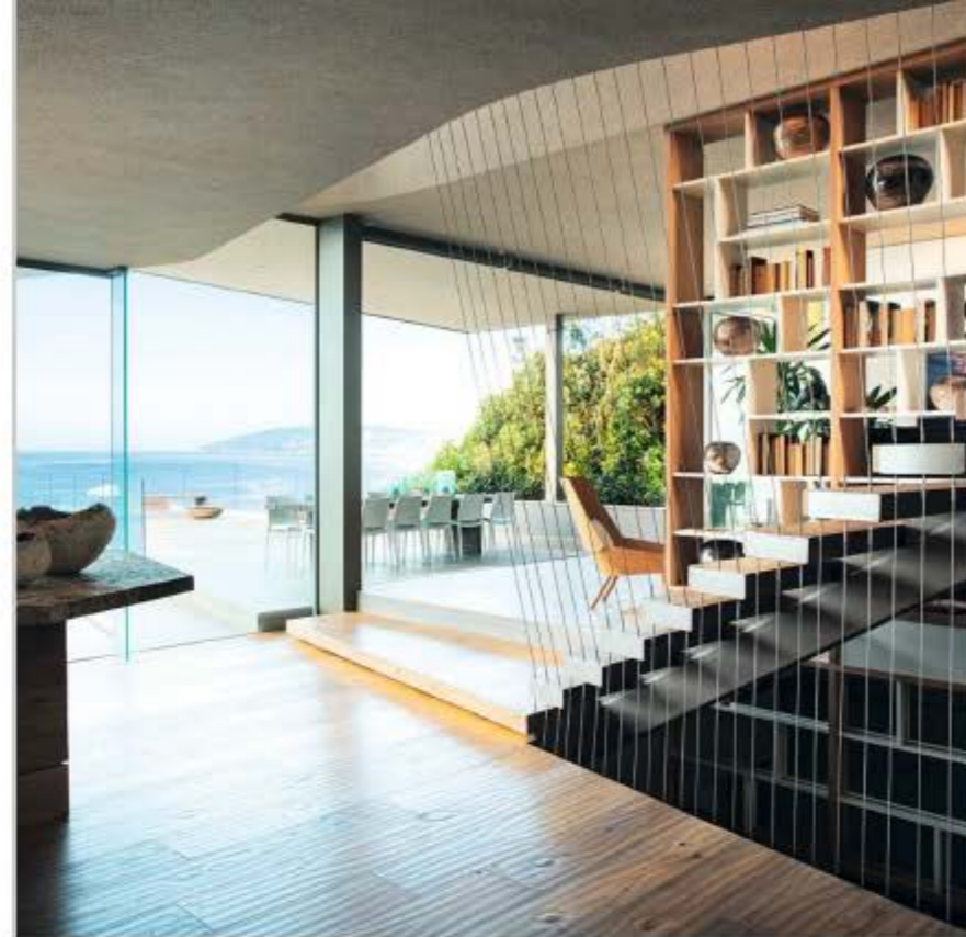
TRANSPARENZ Glas-Schiebtüren lassen das Außen und Innen nahtlos ineinander übergehen.

E ingebettet zwischen dem Naturreservat Robberg im Südosten und den Outeniqua-Bergen im Norden, liegt auf den Dünen der weißen Sandstrände von Plettenberg Bay 'Beachyhead', was frei übersetzt heißt: 'Kopf des Strandes' – geplant und umgesetzt von SAOTA Architecture. Wer auf der Straße, Richtung Süden gelegen, daran vorbeifährt, sieht kaum mehr als ein langgestrecktes, flaches Gebäude aus Holz und Beton, über dessen Eingang sich kaskadengleich üppiges Grün ergießt. Von der Nordseite aus gesehen, öffnet sich jedoch das 1.176 qm große Paradies vertikal zu mehreren Ebenen mit großen Glasfronten, die in einer freiliegenden Terrasse münden.