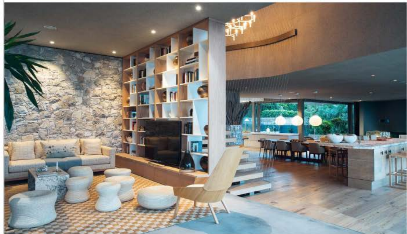
FLIESSEND Der Wohnbereich ist offen und großzügig gestaltet mit viel Platz für Gäste, und dennoch bietet er gemütliche Rückzugsecken.

Der von der Straße aus sichtbare Teil wirkt aus dieser Perspektive wie eine aufgesetzte Skulptur auf einem massiven Sockel aus Naturstein. Elegant und repräsentativ für Gäste sollte das Domizil sein, aber auch gemütlich, falls sich einmal nur ein Familienmitglied darin aufhält. Das waren die Vorgaben für die erfahrenen SAOTA-Architekten. In die Planung flossen außerdem der Stand der Sonne zu den jeweiligen Tageszeiten, die Windrichtung und nicht zuletzt die Aussicht auf die malerische Landschaft. Zudem sollte sich das Haus auf natürliche Weise in die Umgebung einfügen. Das Ergebnis: Die Grundmauer aus regionalem Gestein steht für die Erde, auf der die Schlafzimmer himmelwärts im oberen Flügel – mit einem Putz aus Sandstein als Verbindung zu den Dünen – zu schweben scheinen. Zur Seite gleitende Holzlamellen enthüllen die Fragilität des gläsernen Konstrukts und geben von innen einen atemberaubenden Blick