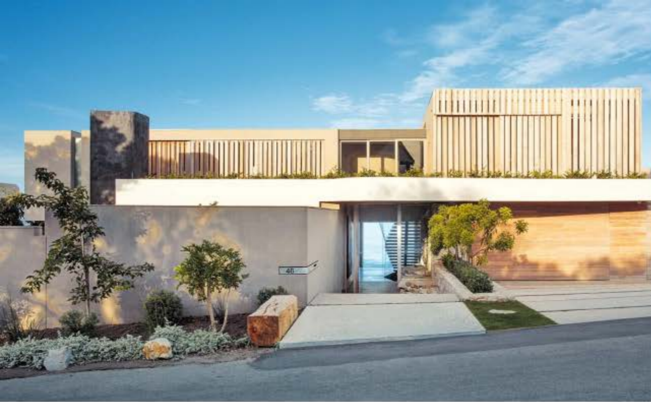
VERBORGENER SCHATZ Von der Straße aus wirkt die Silhouette von 'Beachyhead' bescheiden. Niemand ahnt von der Noblesse dahinter.