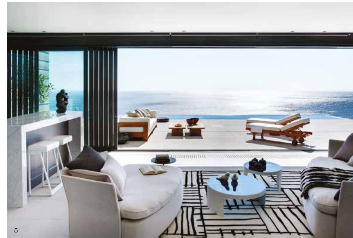
3.室內的織物和裝飾品體現出自然和舒適的氛圍，創造了寧靜的氣息。 4、5.無論是牆面或地上都有著各種幾何線條，在設計上尤為精心。